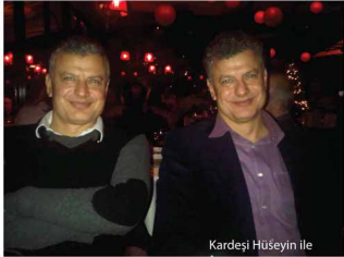
Kardeşi Hüseyin ile

İş dışında aktif sutopu oynuyorum. İzmir'in en iyi sutopu kulübü ESTİ (Ege Su Sporları Tenis İhtisas) Başkanlığı, İzmir Su Ürünleri Üreticileri Birliği Yönetim Kurulu Üyeliği, İzmir Avcılar Kulübü Yönetim Kurulu Üyeliklerimin dışında koleksiyonerlik yapıyorum. Antika eser konusunda sertifikalı koleksiyonerim.